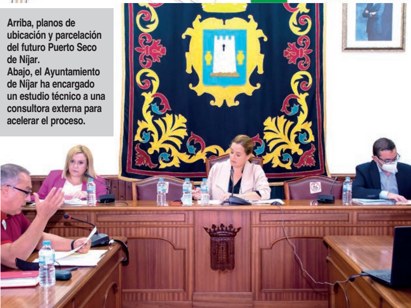
Arriba, planos de ubicación y parcelación del futuro Puerto Seco de Níjar. Abajo, el Ayuntamiento de Níjar ha encargado un estudio técnico a una consultora externa para acelerar el proceso.