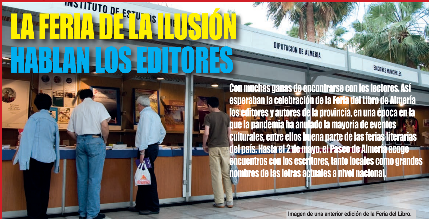
Imagen de una anterior edición de la Feria del Libro.