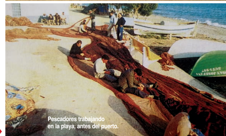
Pescadores trabajando en la playa, antes del puerto.