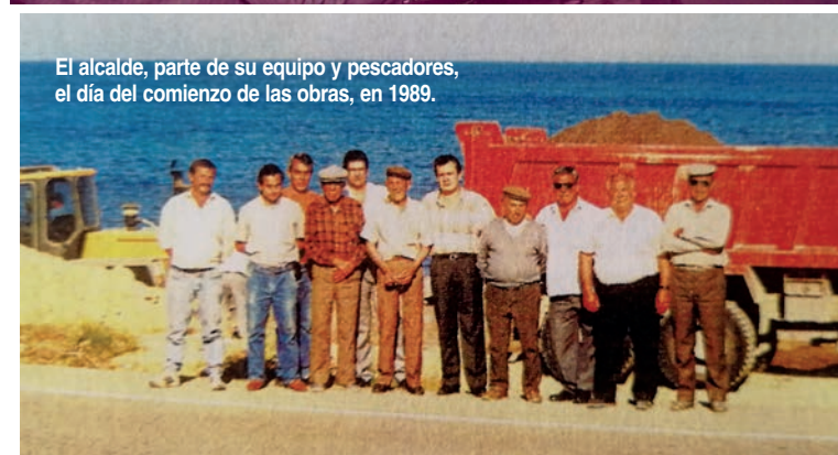
El alcalde, parte de su equipo y pescadores, el día del comienzo de las obras, en 1989.