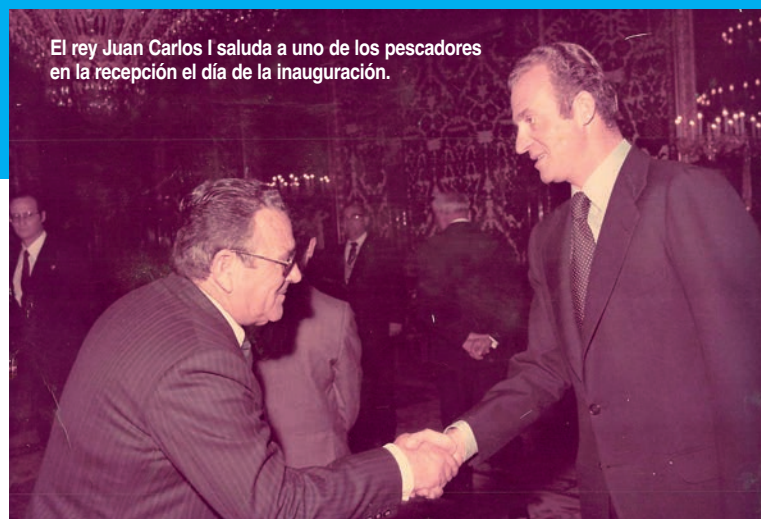
El rey Juan Carlos I saluda a uno de los pescadores en la recepción el día de la inauguración.